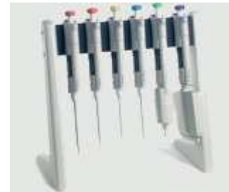
Настільний штатив для автоматических дозаторів: