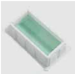
Ванночки для восьми-канальних дозаторів: