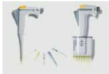
Автоматичні одноканальні (20–200 мкл, 100–1000 мкл) і восьмиканальні (30–300 мкл) дозатори і наконечники: