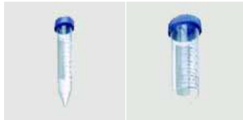
Пробірки полімерні на 15 і 50 мл з кришкою що закручується: